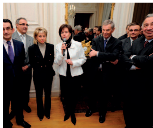
Gérard Miquel, Catherine Dumas, Elisabeth Lamure, Gérard César et Gérard Larcher.

■ Le Club parlementaire de la Table Française, que Catherine Dumas co-préside avec son collègue sénateur du Lot Gérard Miquel, et le groupe d'études « Vigne et vin » du Sénat, représenté par son Président Gérard César et sa Vice-présidente Elisabeth Lamure, ont cette année décidé d'unir leurs efforts afin d'organiser la traditionnelle dégustation des crus du Beaujolais, en présence du Président Gérard Larcher.