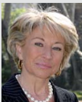
Catherine Dumas Sénatrice Conseillère de Paris